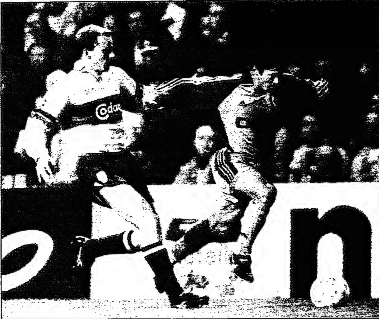
بيكيتز ليز لاعب بايرن ميونيخ (الي اليمين) في حالة تمدد مع جيكس لاعب ريال مدريد.